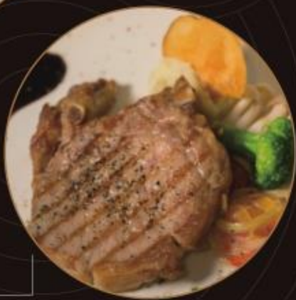
碳烤法式豬排 Grilled French Porkchop