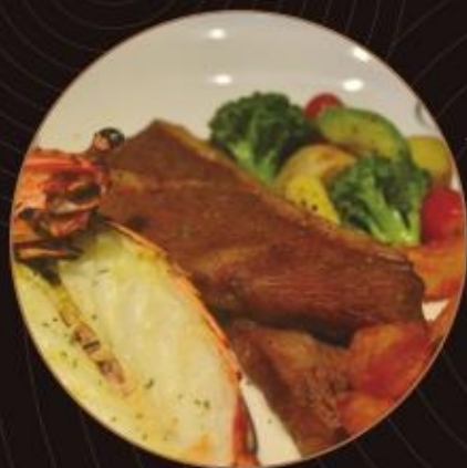
海陸雙拼 Surf and Turf Prime