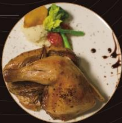
德國豬腳 German Pork Knuckle