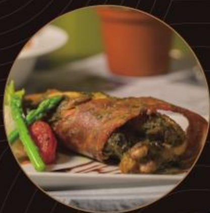
蒜味青醬培根雞腿捲 Garlic Chicken Bacon Roll

Add NT$160 to upgrade to a set meal, including bread, soup or salad and a beverage (up to NT $100)