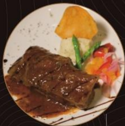
美式蒜味豬肋排 Garlic Pork Ribs